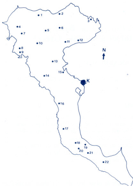
FIG. 1. Ensemble des postes de piègeage installés à Corfou: 1 = Karousades, 2 = Acharavi, 3 = Kassiopi, 4 = Kavadas, 5 = Episkopi, 6 = Episkepsis, 7 = Dafni, 8 = Vistonas, 9 = Lakones, 10 = Trumbeta, 11 = Spartila, 12 = Nisaki, 13 = Poulades, 14 = Ropa, 15 = Kondokali, 16 = Sinarades, 17 = A. Mateos, 18 = Chlomatiana, 19 = Chlomos, 20 = Linia, 21 = Argyrades, 22 = Perivoli, K = Kerkyra (Corfou).

Zone Centre: Poulades, Ropa, Kondokali, Sinarades, Ag. Mateos.